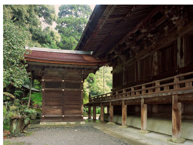
金堂（国宝）と関伽井屋（重要文化財）