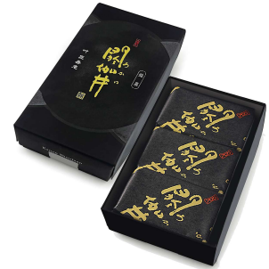
関伽井（黒胡麻）3個入