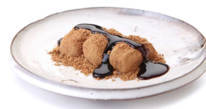
功德の願いを込めた三つの餅