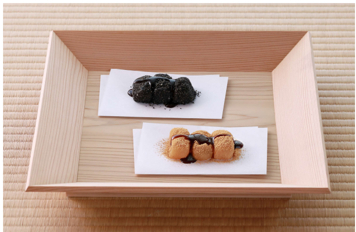
発売から60年を迎えた銘菓「関伽井」

▶商品詳細： https://kanou.com/gnaviplus/item/akai/