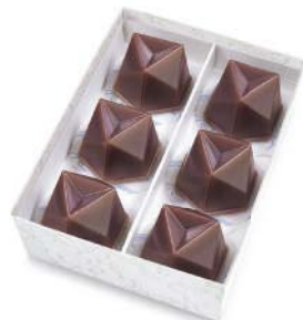
MZ-20 水羊羹 6個入 2,160 円(2,000 円)