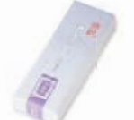
夏限定パッケージ