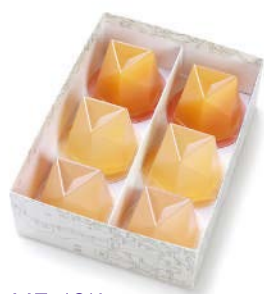
MZ-18K 濃果汁詰合せ 6個入 1,988 円(1,840 円)