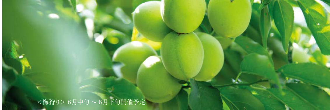
<梅狩り> 6月中旬～6月下旬開催予定

叶匠壽庵が本社を構える 滋賀県大津市大石龍門。 六万三千坪の 自然豊かな丘陵地では、 菓子の原料である 城州白梅などを 育てています。 苑内には菓子売場、 お茶室、お食事・甘味処、 ベーカリーなどが ございます。 四季の移ろいを肌で感じ、 心休まるひとときを お過ごしください。