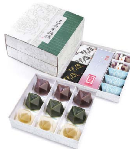
がせん GS-72 雅撰二段

創業当時、今までにない独自のスタイルを開発しようと、重箱形式の箱をつくり上げました。色々な化粧をした個包装菓子がぎっしり詰められた姿は、まさに菓子の玉手箱。多くのお客様から現在も愛されています。