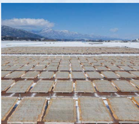
厳しい寒さの中で干す天然糸寒天

昔ながらの製法で凍てつく寒さの中寒天を外気で凍らせて、日光と風で溶かし天日乾燥することをおおよそ2週間繰り返し続けます。長野県伊那地域は、冬場の寒さが厳しく乾燥して晴天が多いことが寒天づくりに最適なのです。