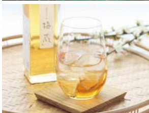
上／梅蔵内で熟成する 下／「寿長生の郷梅蔵」 （販売店舗） 寿長生の郷・札幌三越店

「農工ひとつ」を掲げ、寿長生の郷 に本社を移して41年。その理想を 実現するひとつとして菓子工場の 一角に梅蔵があります。郷で育て た梅を菓子にする為に熟成させる その蔵は、壁を厚くすることで室 温を保ち、熟練の職人の徹底した 管理のもと里山の恵みを昇華させ ています。