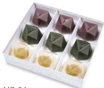
MZ-34 水羊羹詰合せ 9個入 3,726 円(3,450 円)