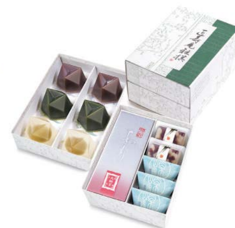
がせん GS-50 雅撰二段

上段 / 闊伽井(黒蜜きなこ・黒胡麻) 各 2 個、 あも 1 本、夏の玉露地 2 個、栗山家 3 個 下段 / 水羊羹・抹茶水羊羹・郷の水室(梅) 各 3 個