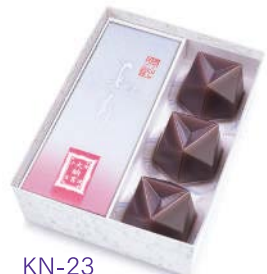
KN-23 あも・水羊羹詰合せ