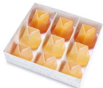
MZ-27K 濃果汁詰合せ 9個入 2,981 円(2,760 円)