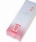
夏限定パッケージ