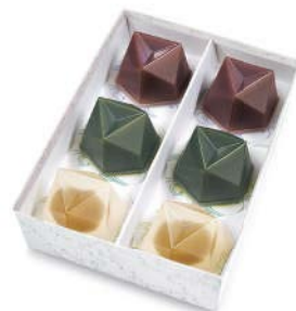
MZ-23 水羊羹詰合せ 6個入 2,484 円(2,300 円)