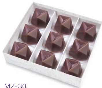
MZ-30 水羊羹 9個入 3,240 円(3,000 円)